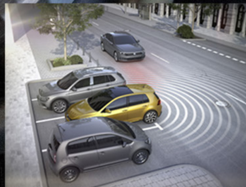
Hỗ trợ tiến/lùi vào chỗ đỗ xe vuông góc

**Trang bị chỉ có trên phiên bản Luxury S**