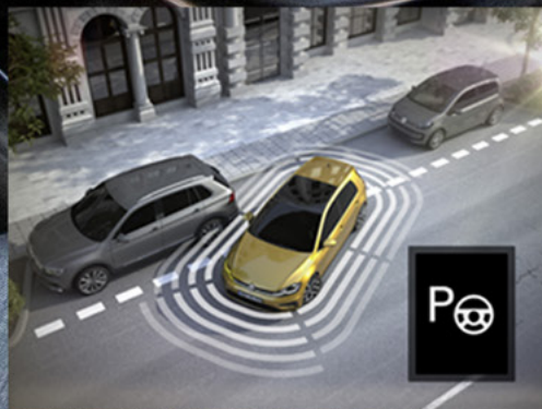
Hỗ trợ tiến/lùi vào chỗ đỗ xe song song