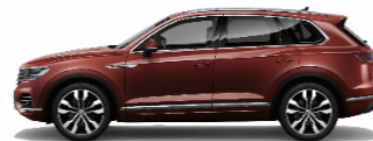
Malbec red Metallic X4X4