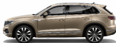
Sechura Beige Metallic 5Q5Q