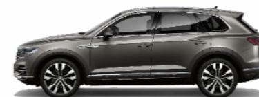
Silicon Gray Metallic 3M3M