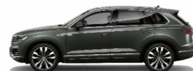
Jupiter green Metallic 6H6H