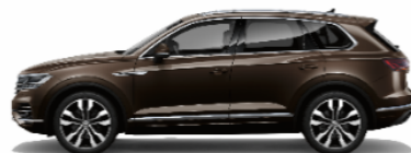
Tamarind Brown Metalic 3V3V