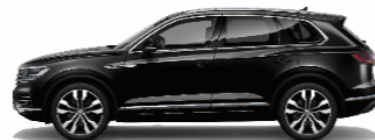
Deep Black pearl effect 2T2T