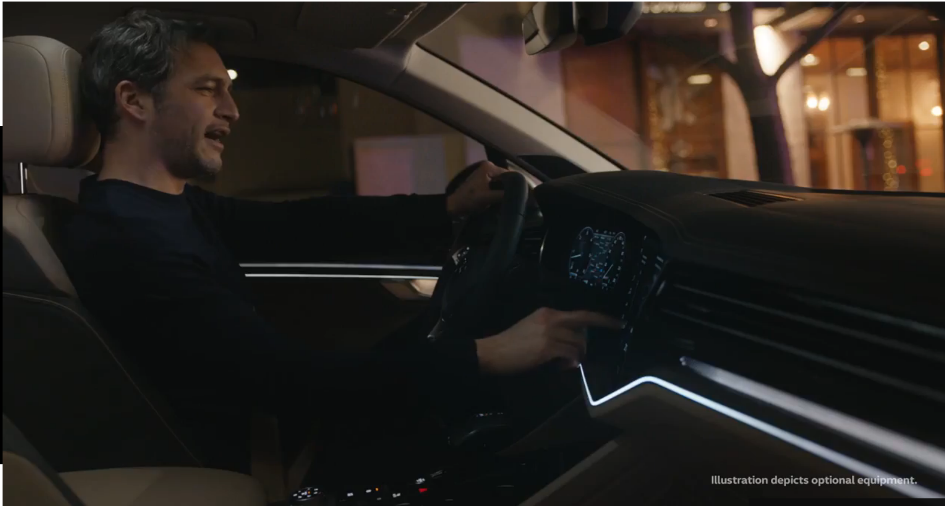
Illustration depicts optional equipment.

Đắm chìm trong không gian nội thất đầy màu sắc.