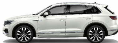
Pure white 0Q0Q