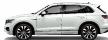
Oryx white mother-of-pearl effect 0R0R (cộng thêm 50 triệu)