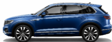
Aquamarine blue Metallic 8H8H