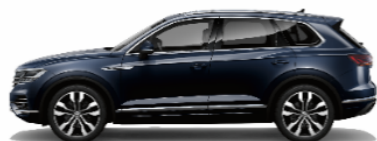
Moonlight Blue pearl effect C7C7